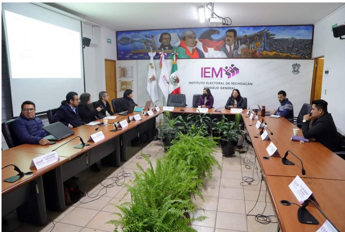
Reunión de Trabajo Formal de la Comisión del PREP, del 14 de diciembre de 2023